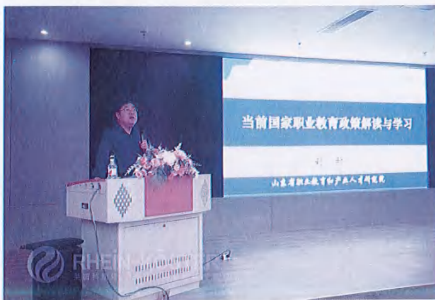
图24 （职业教育教师团队建设培训会）

升教师科研能力、实践能力和生产案例的转化能力。引进青年才俊教师、产业导师，培养骨干教师和名师，实施进阶式教师培养工程，提升教师素养，建设高水平教师队伍。