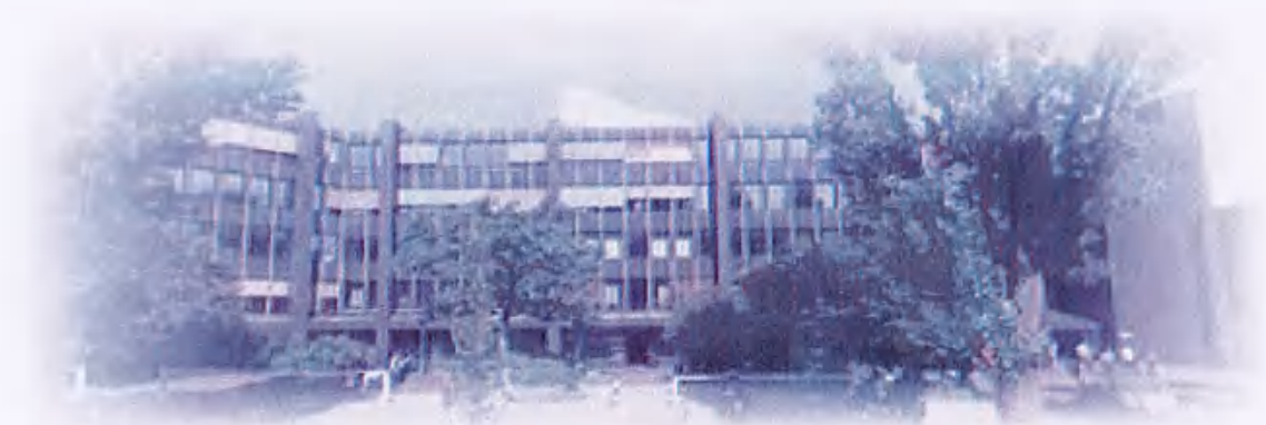
图20 （德国巴伐利亚中文学校）

德国巴伐利亚中文中心学校是1995年由家长们自发成立的公益性中文学校。经过近三十年的努力，由最初的二十四名学生发展成为拥有大约1000名学生，40多名教师，成为德国南部规模最大，影响最广的中文学校，并荣获国务院侨务办公室和中国海外交流协会海外“华文教育示范学校”的称号。到目前为止，学校仍保持着最初的公益性组织的机制。