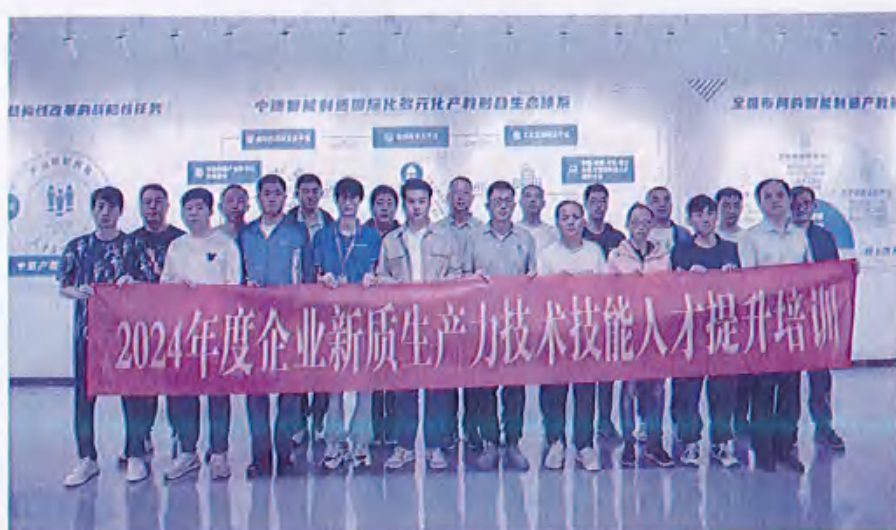
图27（新质生产力技术技能人才提升培训）

字经济发展输送专业人才。紧密围绕服务黄河国家战略，以及深化新旧动能转换和绿色低碳高质量发展的需求，对学生进行联合教育与教学管理。通过这种普职融通、双向并轨的创新办学体制，为不同学习路径的学生提供多元化发展机会，助力每一位学生找到最适合自己的成才之路，实现多样化的人生目标。