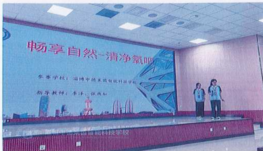
图4 （大赛现场项目展示）