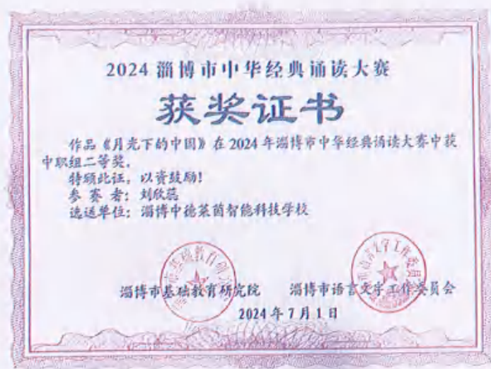
图1 （淄博市中华经典诵读大赛二等奖）

其次，我们加强德育队伍建设，形成“三全”育人格局。扎实推进全员参与、全方位覆盖和全过程管理，建立校级领导联系年级，中层干部联系班级，一线教师联系学生的网格化管理模式。在此过程中，我们突出班主任专业培训的重要性，并组织班主任进行校内外培训，同时举办学生管理工作联席会议，以深化家校合作，通过家庭走访活动等加强沟通。此外，每周召开学生干部例会，将责任感与服务意识培养纳入日常管理培训，实现学生干部培养的系统化和规范化。同时强化道德素养教育，每月开展主题德育活动，并组织各类丰富多彩地学生社团活动，为学生提供多样化的发展机会。