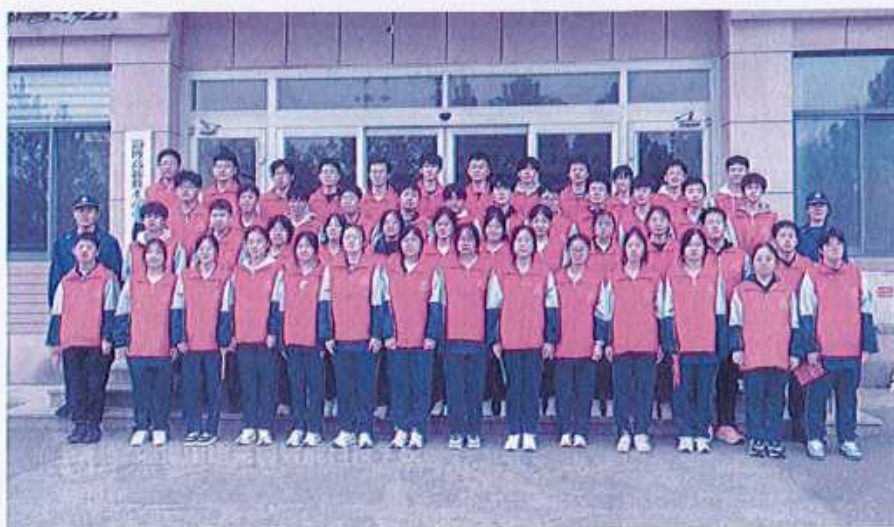
图47 （学生参加消防安全宣传志愿服务活动）