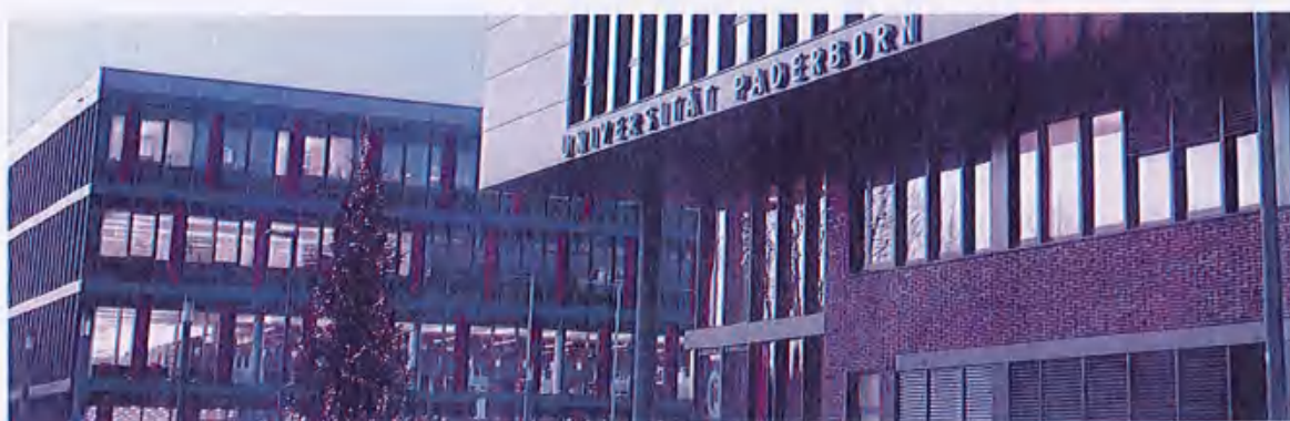
图22 （德国帕德博恩大学）

我校赴德本科留学班合作院校——帕德博恩大学是一所集教学，科研，娱乐休闲，住宿于一体的开放式校园大学，成立于1972年，坐落于德国北莱茵威斯特法伦州的帕德博恩市。作为一所德国公立的综合性大学，帕德博恩大学拥有两千余名教职员工和两万多名在读学生，其中包含254位德高望重的教授及上千名教学经验丰富的科学助理。