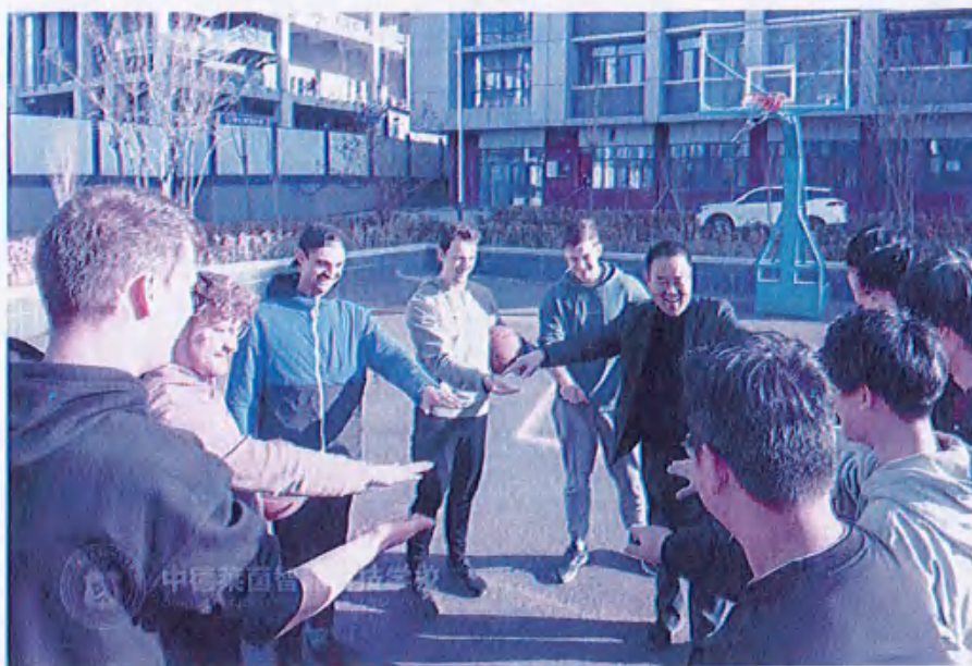
图15 （中德篮球友谊赛）

在文化交流环节，学访团参与了书法学习活动。书法老师详细讲解了书法的历史渊源、书写技巧，并现场带领学员们研墨执笔，德国学生们饶有兴致地拿起毛笔，认真临摹，感受中国传统书法艺术的独特魅力。他们专注的神情和积极的态度，让书法课堂充满了浓厚的文化氛围，书写下的“中”、“德”两字，也寓意着中德两国的友谊之花长盛不衰。