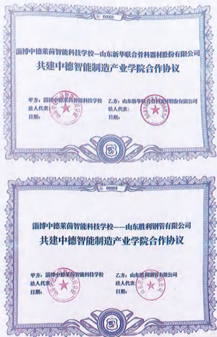
图26（与多家企业共建产业学院）

在校企合作方向，双方围绕人才培养与产业需求紧密对接。企业深度参与学校的专业规划与课程设计，依据自身生产实际和行业发展趋势，为智能制造装备专业课程体系的搭建提供一手资料与宝贵建议。例如，在制定智能控制技术课程内容时，