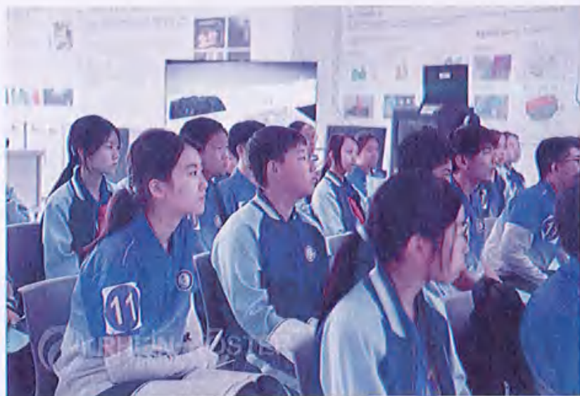
图39 （淄博柳泉中学研学活动）

此次研学之旅让同学们走出课堂，通过亲身体验和实地考察，深化了大家对先进制造技术的理解与认识，为他们的未来发展奠定了坚实基础。同学们纷纷表示，通过此次研学不仅了解了智能制造技术的原理和应用，也加深了对先进制造技术的理解和认识，感受到了科技创新带来的巨大潜力。同时，研学之旅也激发了大家对科技创新的热情，激励他们努力学习，为未来的科技发展贡献力量。