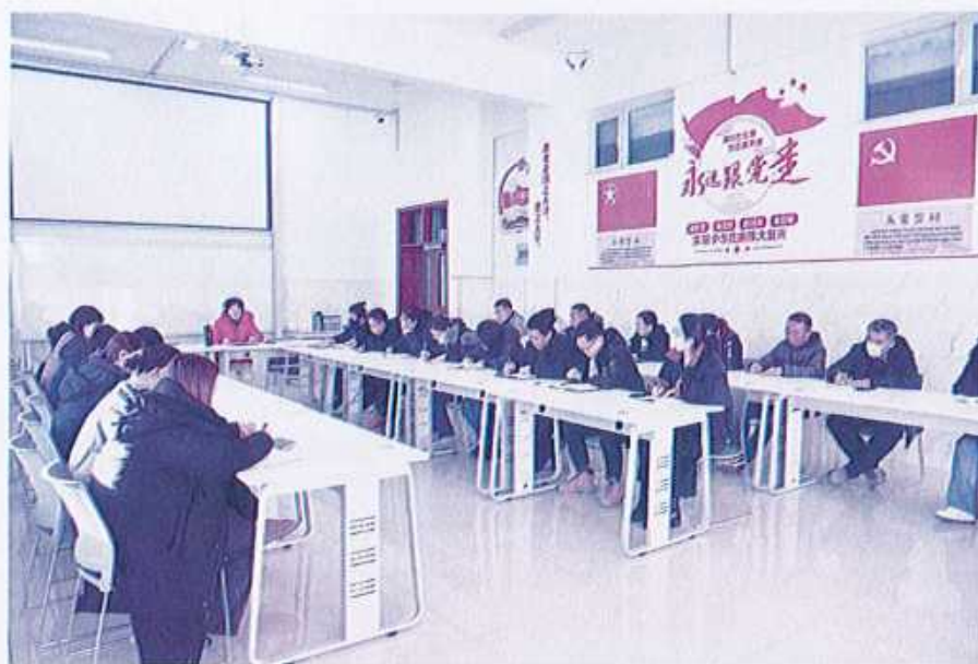
图31 （全体教职工安全管理会议）