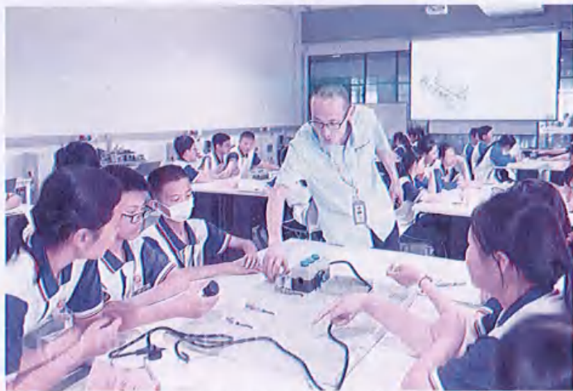
图38 （淄博中学研学活动）

此次研学涉及虚拟技术、自动化、电气、机械等专业，莱茵科斯特培训师们为大家带来巧克力工厂探秘、空气的妙用、机电一体化装置操作体验、虚拟现实技术应用、我为自己颁个奖、电的生命循环等多门实践课程，通过实地观摩、小组自主学习、沉浸式体验等方式，引导学生们在社会实践中接受知识教育、劳动教育，增强同学们解决困难和团结协作的意识，同时激发他们探索科学、追求真知的好奇心。