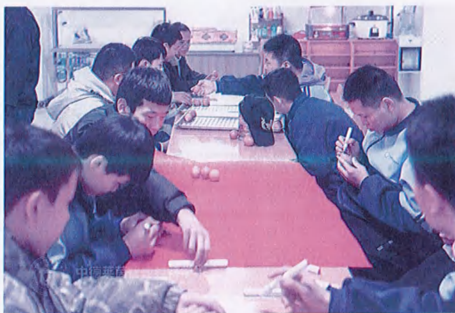
图14 （清明节“画彩蛋”活动）

通过本次活动，我们成功地将清明节画蛋这一传统习俗引入校园，激发了学生对传统文化的兴趣。未来，我校将继续以传统节日为契机，开展更多形式多样的文化传承活动，丰富学生的文化生活，为传承和弘扬中华优秀传统文化贡献力量。