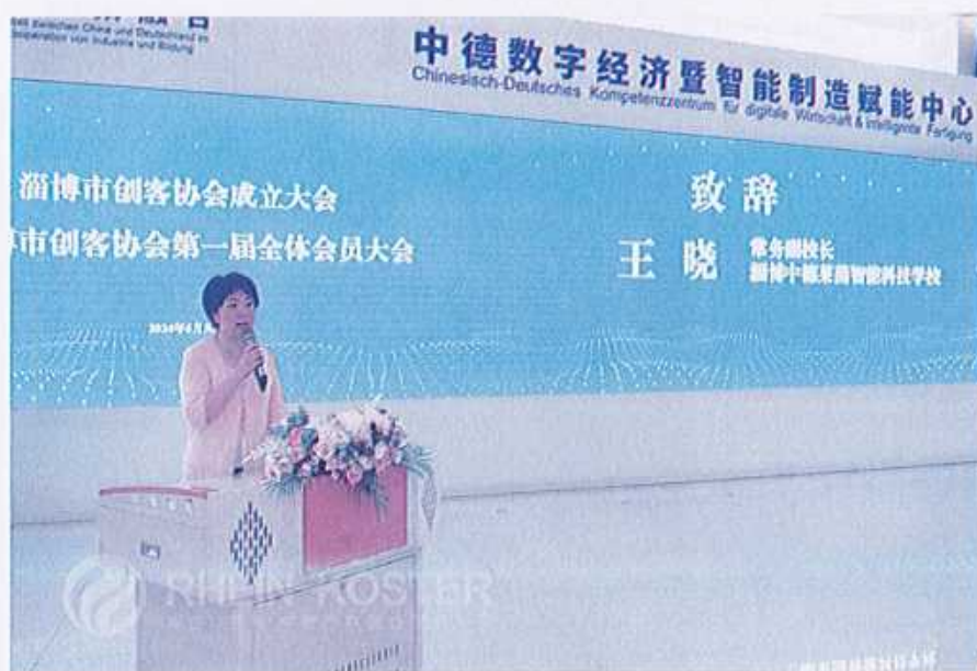
图36 （淄博市创客协会成立大会）

力量。淄博中德莱茵智能科技学校是莱茵科斯特在探索产教深度融合、推动教育创新道路上的一个重要成果，拥有卓越的中德师资团队和德国优质教学资源，着力培养具有国际视野的创新人才，为推动高质量发展提供有力的人才支撑。