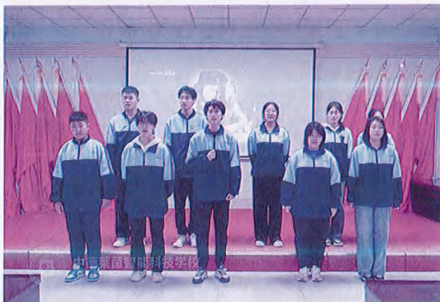
图7 （以“雷锋精神”为主题的演讲）

雷锋精神作为中华民族优秀文化的璀璨明珠，通过此次活动在校园内得到了深入传承与弘扬。我们将雷锋精神巧妙融入校园文化建设，开展了以雷锋精神为主题的校园文化活动，如征文比赛、演讲比赛、文化展览等。这些活动丰富了学校的文化内涵，营造了互帮互助、积极向上的浓厚文化氛围。学生们在参与活动的过程中，潜移默化地接受着优秀文化的熏陶，将雷锋精神内化为自己的价值观与行为准则，成为雷锋精神的忠实传承者与积极传播者。