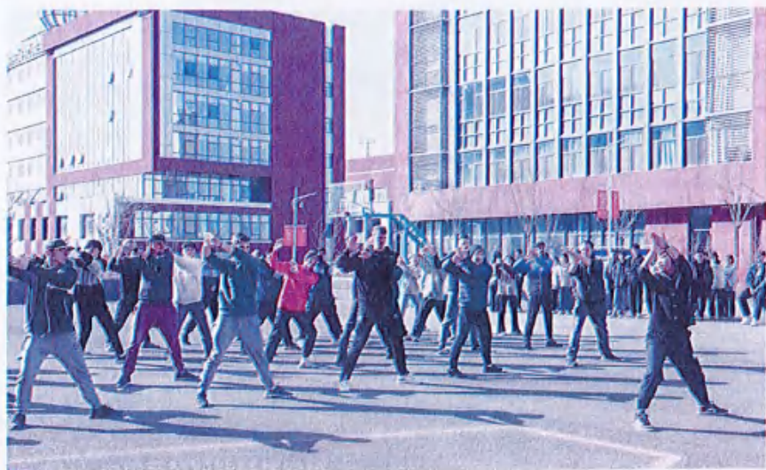
图17 （德国技术学士学习太极拳）

此次交流活动，通过实地参观、体育竞技和文化体验，搭建起了中德教育交流的桥梁。展示了我校的教育成果和民族文化特色，也为学生提供了与国际友人交流互动的平台。未来，我校将继续加强国际交流合作，开展更多形式的交流活动，推动教育国际化进程。