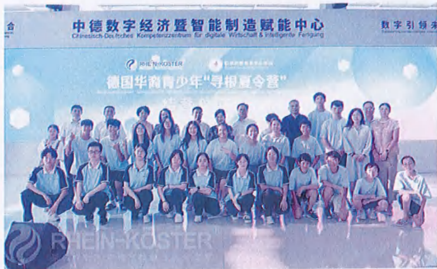
图19 （德国华裔青少年“寻根夏令营”结营仪式）

山和山不相遇，人和人要相逢。赏齐鲁之韵，品齐鲁之美，从传统到现代，从历史文化、民俗风情到科技创新，此次“寻根夏令营”让德国华裔青少年们大开眼界，全程欢声笑语，气氛热烈。营员们在采访中表示，此次夏令营让他们对中华文化有了更加直观和深刻的理解，结识了许多志同道合的朋友，是一次难忘的人生经历。