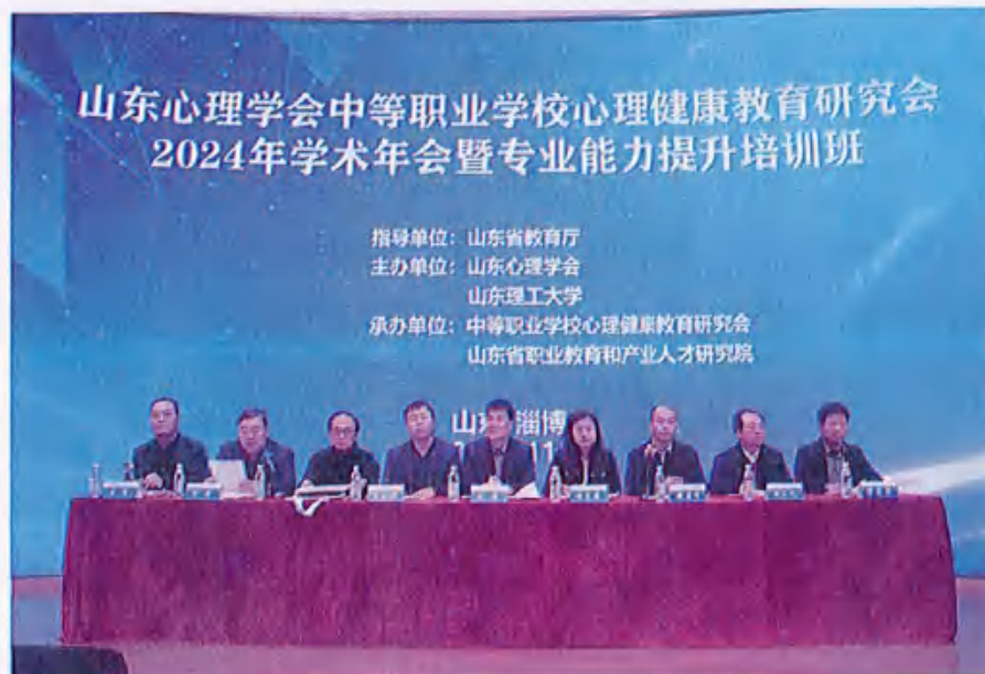
图2 （组织全体教师参加山东心理学会中等职业学校建立健康教育提升培训班）

学校高度重视学生的身心健康，实施“身体+心理”双维度的学生素质提升工程。积极引导学生参加各类体育运动，组织开展了趣味运动会、篮球赛等特色体育活动，并坚持每天锻炼一小时，以提升学生的体质健康水平。同时，我们也注重学生的心理健康，学校建设有高标准的心理咨询室，配备专兼职结合的心理辅导教师团队。每个月我们会对学生进行一次心理健康状况筛查，建立详尽的学生心理档案，并对存在问题的学生开展一对一谈话，以提供针对性的支持和帮助。学校着力建设“心理健康特色校园”特色，将心理健康教育摆在学校教育教学活动的重要位置。