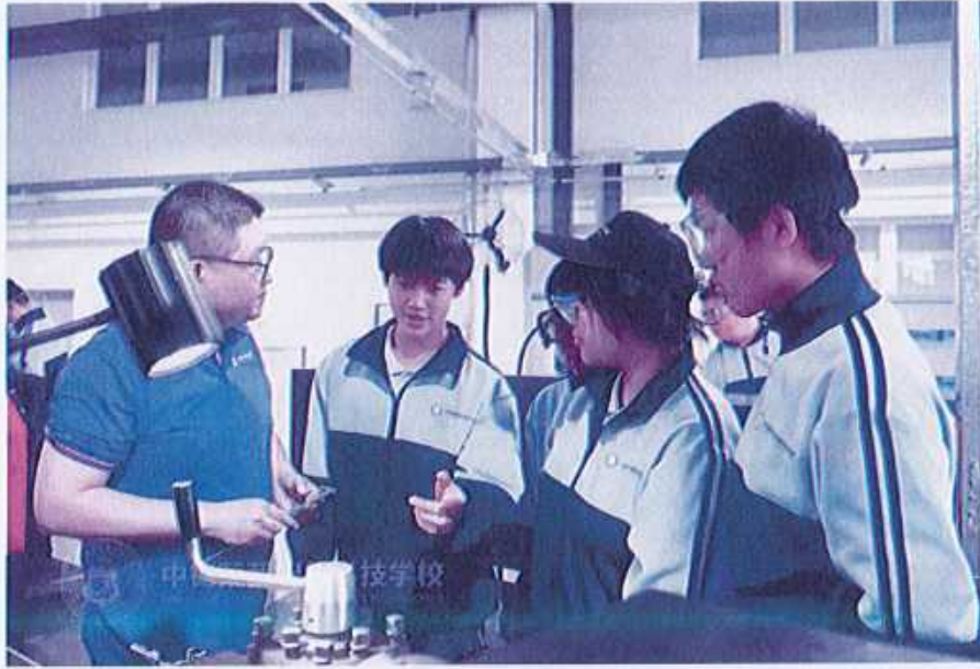
图25 （本校学生实训课堂）