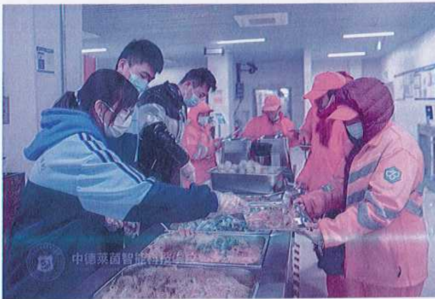
图9 （环卫工慰问活动）

通过这次活动，进一步增强了学校师生的社会责任感和奉献精神，营造了全社会尊重和关爱环卫工人的良好氛围。未来，我校将持续开展此类公益活动，传递爱心与温暖，为构建和谐社会贡献更多力量。