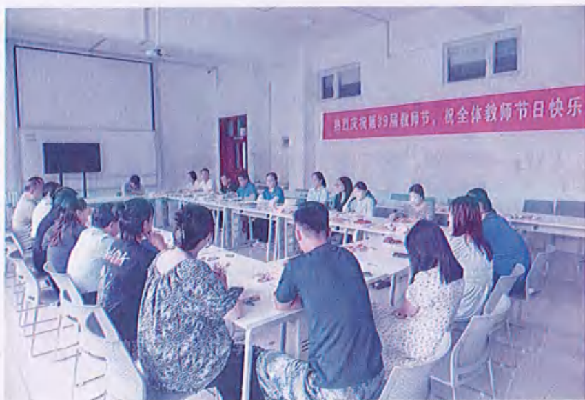
图33 （庆祝第39届教师节）

在浓厚的节日氛围中，全体教师再次感受到了作为一名人民教师的骄傲与自豪，大家纷纷表示，一定要立足本职岗位，创先争优，担当作为，用爱和责任点亮学生们的未来，为学校高质量发展贡献力量。下一步，学校也将以此教师节为契机，营造尊师重教的风尚，激励全校教师为党育人，为国育才，躬耕教坛，立德树人，无愧人民教师的光荣称号！