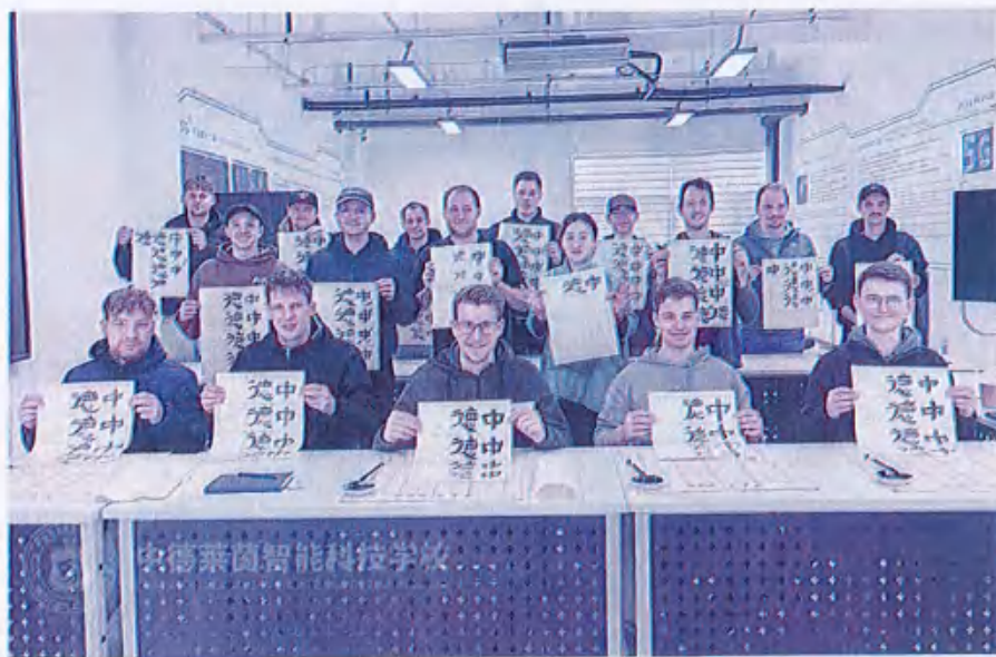
图16 （德国技术学士传统书法课堂）

除了书法学习活动，学访团还参与了太极拳学习。太极拳老师先为德国学生们介绍了太极拳的起源、发展历程以及蕴含的哲学思想，让他们对这项传统武术有了理论层面的认知。接着，老师亲自示范太极拳的基本动作，从起势、野马分鬃到白鹤亮翅，一招一式耐心演示。德国学生们认真模仿，尽管一开始动作稍显生疏，但在老师的悉心指导和反复练习下，逐渐掌握了动作要领，一招一式有模有样。他们沉浸在太极拳刚柔并济的独特魅力中，现场洋溢着浓厚的传统文化学习氛围。