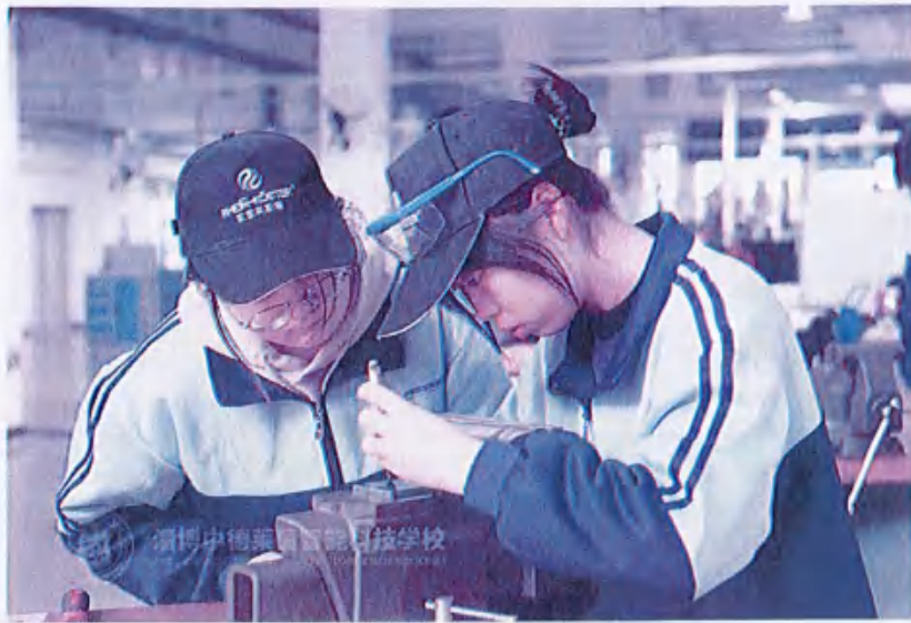
图23 （学生企业实训课程）