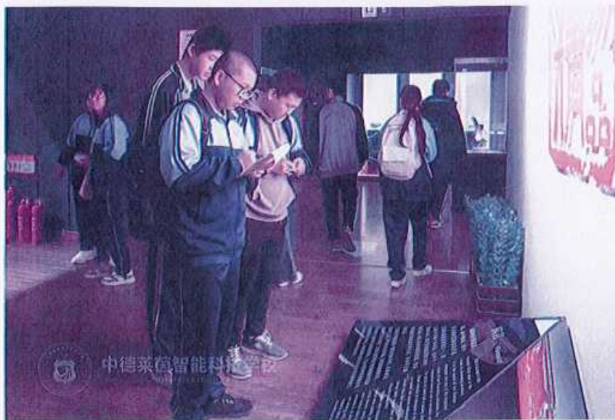
图12 （参观淄博市博物馆）

此次活动的成功举办，不仅让同学们得以零距离领略淄博厚重的文化底蕴与悠久的历史沉淀，更让他们深切感受到先辈们躬耕不辍、追求卓越、无私奉献的伟大精神。学生们纷纷表示，作为新时代的青年，定当传承中华优秀传统文化，继承革命精神，在祖国广袤的大地上继续挥洒汗水，播撒希望。