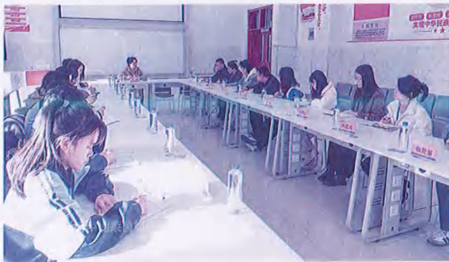
图30 （第一届膳食委员会成立会议）

贯彻落实校长负责制，修订学校章程，制订《教学工作指导手册》《教师薪酬体系管理办法》《教师职称评审推荐办法》《青年教学名师评选与管理办法（试行）》《教师课堂教学评价办法》《学校财务制度》《学校消防安全管理制度》《学校医务室管理办法》等规章，成立“学校第一届教学督导委员会”“学校学生防欺凌治理委员会”“食品安全管理领导小组”、成立“膳食委员会”工作组，涵盖教育教学、学生管理、消防安全、食品安全，综合治理等5大方面，计划逐步完善学校各项制度群组体系和内部控制体系。构建管理“闭环化”体系建设，实现评学、评教、教学督导委员会查课堂制度化、经常化的“两化”实现理论教学与实操教学相结合的“双元制教学”。