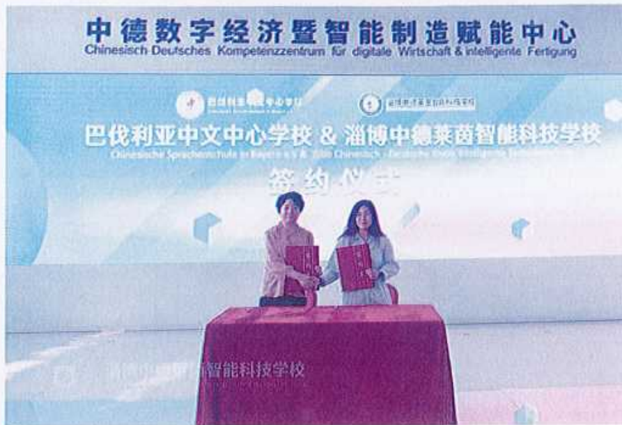
图21（巴伐利亚中文中心学校与淄博中德莱茵智能科技学校签约）