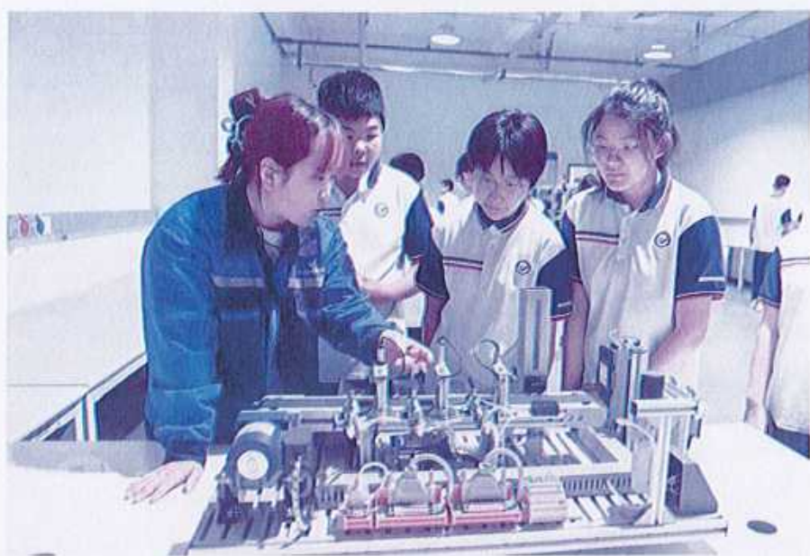
图37 （高新区实验中学研学活动）