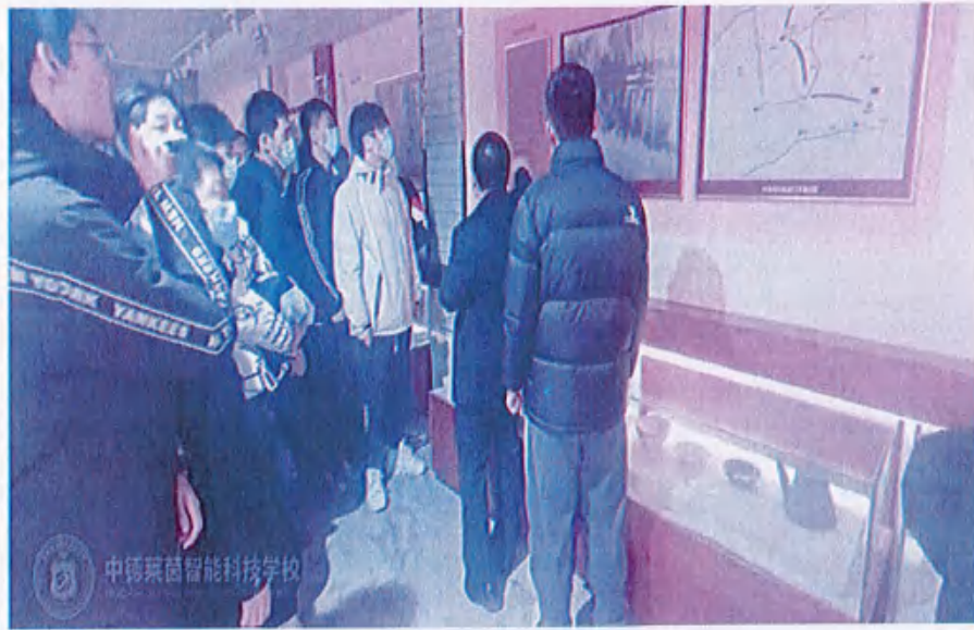
图11 （参观黑铁山抗日武装起义纪念馆）

此次党史教育活动，是我校加强思想政治教育的重要举措。通过实地参观学习，全体师生更加深刻地认识到中国共产党的伟大历程和辉煌成就，进一步增强了对党的认同感和归属感，激发了师生们的爱国热情和奋斗精神。未来，我校将继续丰富党史教育形式，持续推动党史学习教育走深走实，让红色基因在师生心中生根发芽、开花结果。