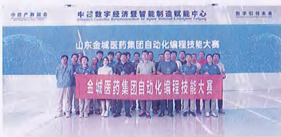
图28（自动化编程技能大赛）