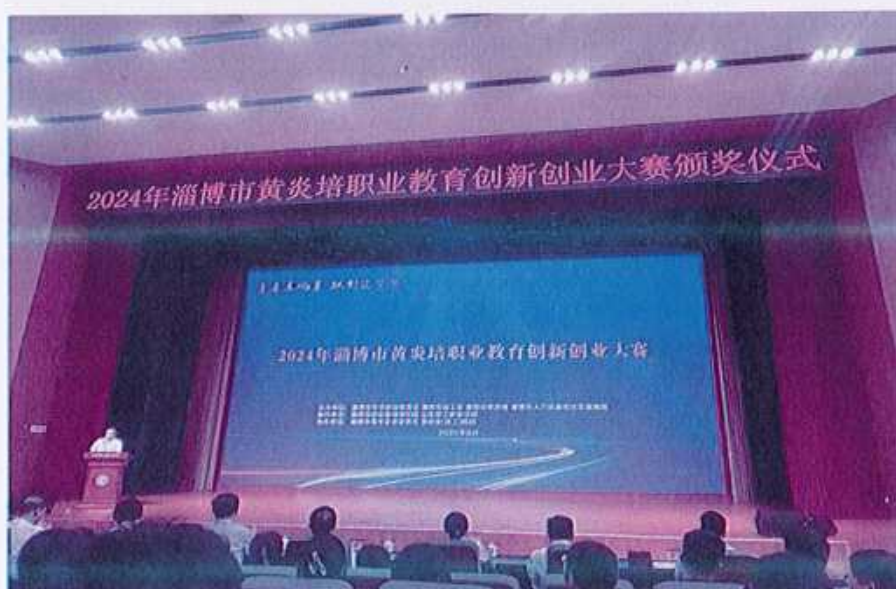
图5 （创新创业大赛颁奖仪式）