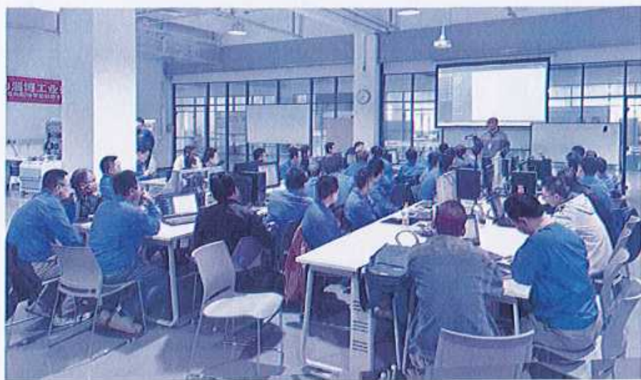
图29 （电气技能培训比武）