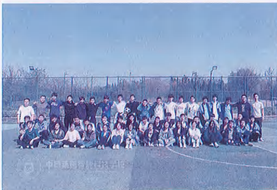
图35 （组织班级足球友谊赛）

伴随着一阵阵的呐喊声，小小的足球在队员的脚下不断穿梭。足球健儿们激情追逐足球，就像草原上一匹匹脱缰的骏马，他们不断地奔跑着，为队伍的荣誉而奋战。现场观众热情地为他们呐喊助威，一浪高过一浪的加油声把比赛推向高潮。小小的足球传递的不仅是同学们对体育运动的热爱，更是他们永不服输，坚持到底的体育精神。