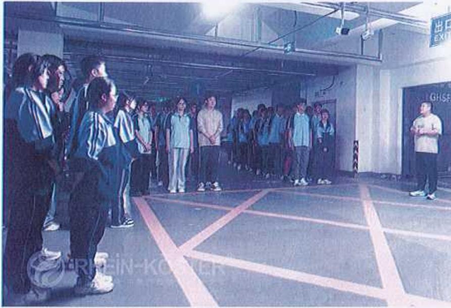
图49 （紧急疏散演练活动）