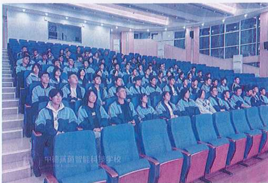
图34 （开展行为规范主题教育活动）